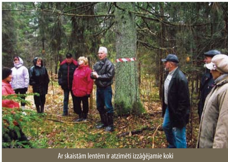
Ar skaistām lentēm ir atzīmēti izzāgējamie koki

Ar skaistām lentēm ir atzīmēti izzāgējamie koki. Faktiski viss konkrētais gabals ir kailcirtes statusā un arī ciršanas apliecinājums (senāk sauca — ciršanas biļete) tiek izņemts kā kailcirtē. Tas nekas, ka „kailcirtē” nogabalā tiks izcirsti tikai četri koki — izzāgē tos un noslēdz tā gada meža „atkailināšanu”. Mežs „Kalna Gaviešos” patiesi ir skaists.