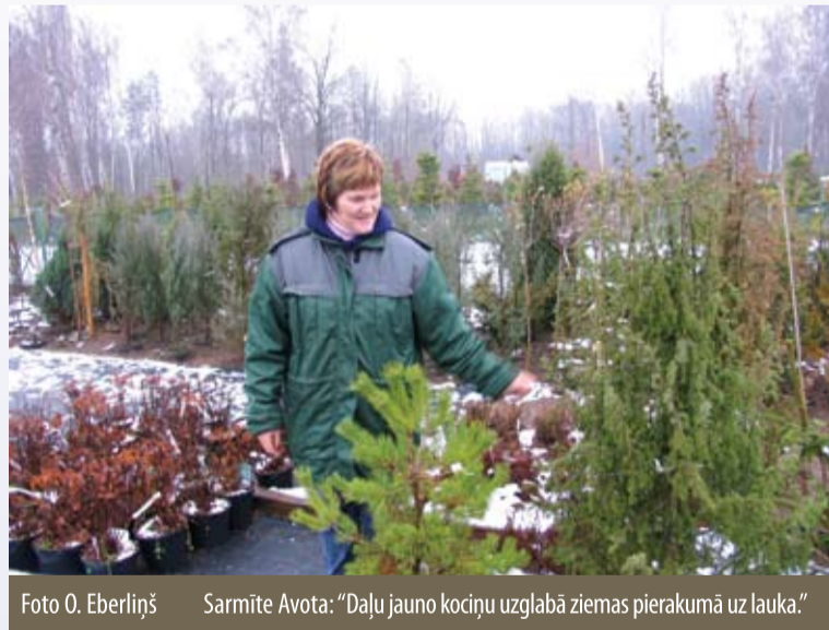
Sarmīte Avota: „Daju jauno kociņu uzglabā ziemas pierakumā uz lauka.”

A. K. Manas izjautāšanas mērķis — atgādināt mežu īpašniekiem, ka ziema, lai cik tā gara, pāiet. Ne velti latviešiem ir paruna par ratu un ragavu gatavošanas vēlamo laiku. Ārā ir –3 grādi, bet tu un