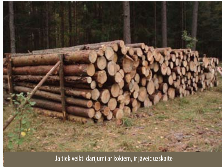
Ja tiek veikti darījumi ar kokiem, ir jāveic uzskaitē

Minētie noteikumi stājas spēkā ar 2007. gada 10. novembri un nosaka: