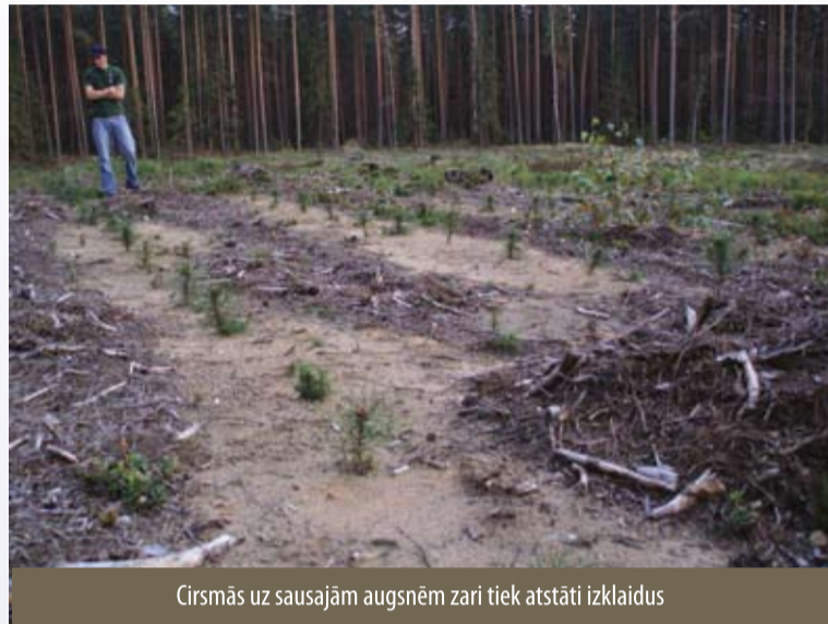
Cirmsmās uz sausajām augsnēm zari tiek atstāti izklaidus

M ežu kopplatība ir 8,97 milj. ha (0,24 ha uz iedzīvotāju), valsts mežainums 28,7%. Koksnes krāja valstī vidēji 203 m 3 /ha (valsts mežos 222 m 3 /ha). Kopkrāja kopš 1967. gada ir nemitīgi palielinājusies.