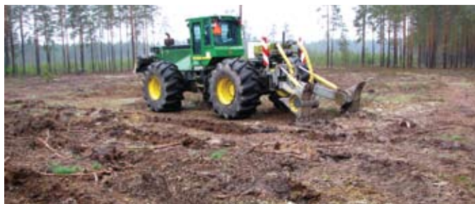
Mehanizētās sēšanas eksperimenta ierīkošanas SIA Rīgas Meži Juglas mežniecībā

Interesanti, ka par labāko un ekonomiski efektīvāko augsnes sagatavošanas agregātu igauņu kolēģi vienprātīgi atzina pašu mājās konstruētu un uz Baltkrievijā ražota lauksaimniecības traktora bāzes uzmontētu kupicotāju, kura prototips savulaik noskatīts... Latvijā! Nelielais degvielas patēriņš, mazās eksploatacijas izmaksas un traktora vienkāršā pārvietošana no cirsmas uz cirsmu (nav nepieciešams treileris) ir faktori, kas šā traktora darbu padara ekonomiski daudz izdevīgāku salīdzinājumā ar, piemēram, diskveida meža frēzi, kura tiek montēta uz