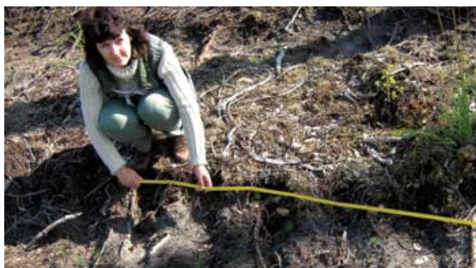
Dagnija Lazdiņa mēra ar sējmašīnu sētos priedes sējeņus

Arī Latvijā ir plaši reģioni, kuros dominē priežu mežaudzes un kur sēšana būtu veiksmīgi izmantojama, kā tas agrāk ticis darīts. Lielākā atšķirība starp Igauniju un Latviju ir reprodiktīvā materiāla cenā. Igaunijā 1 kg priedes sēklu maksā aptuveni Ls 56, bet Latvijā līdzvērtīgs mate-