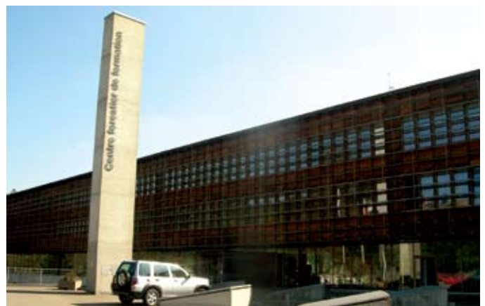
Šveices meža mācību centrā kopš1969. gada vācu un franču valodā māca meža tehniskos speciālistus (kvalificētus mežstrādniekus un zemākā līmeņa speciālistus). Modernais trīs stāvu koka konstrukciju mācību centrs uzbūvēts 1996. gadā, un tā celtniecībai izmantoti 2 000 kubikmetri kokmateriālu.