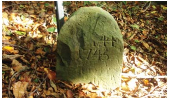
Vēsturiski saglabājušās īpašumu robežzīmes

Mums tika dota iespēja iepazīties ar darbu četrās no deviņām mežniecībām. Vācu kolēģi