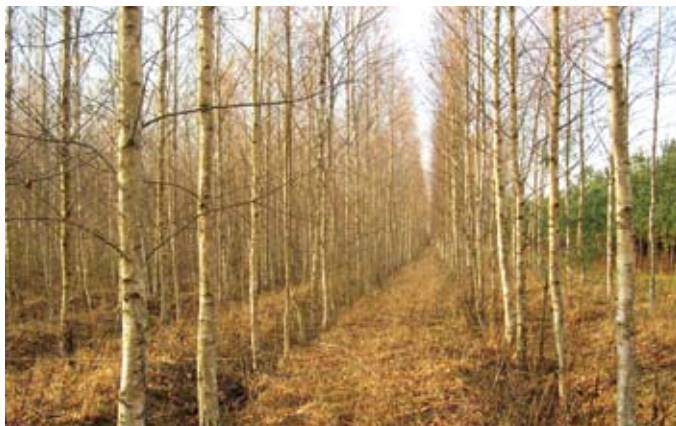
1997.gadā stādītie bērzi krietni paaugušies

Jānis Vigants var būt gandarīts par iestādītajām un koptajām priežu un egļu jaunaudzēm,